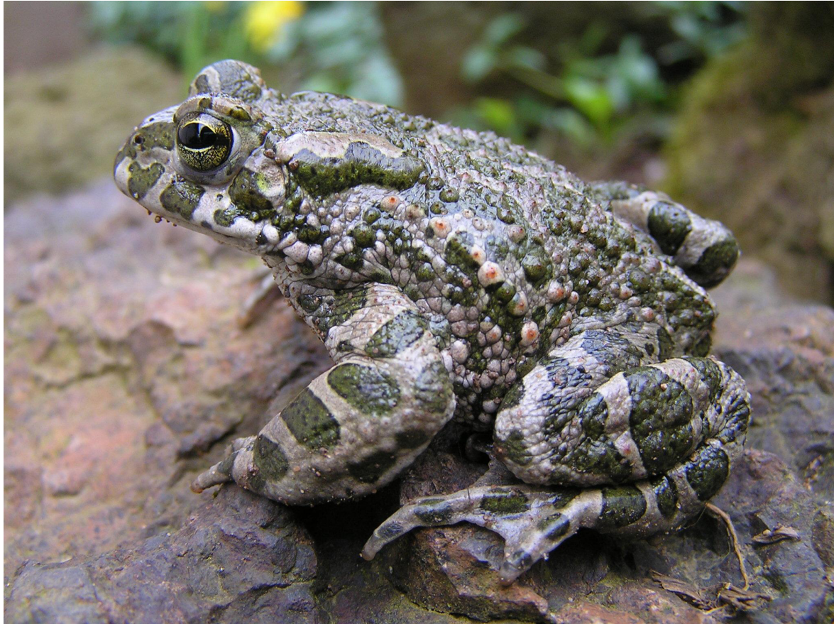
Abb. 1: Adulte Wechselkröte (♂) bei Sinnerthal/Kläranlage