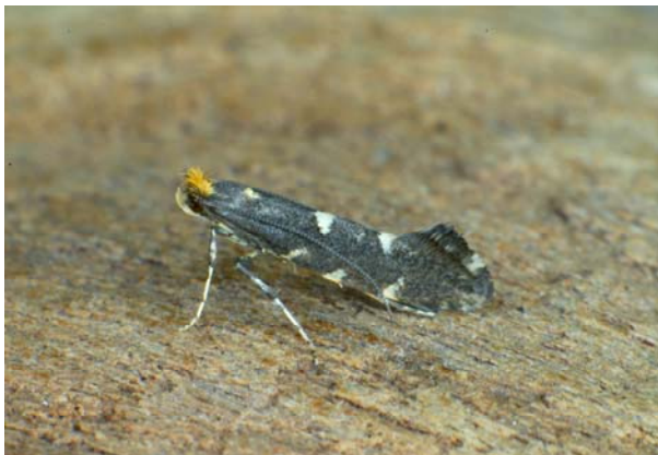
Abb. 3: Callisto denticulella (THUNBERG, 1794) 1 ♀ Lf. 22.05.2006, Illingen (Garten HIR1)