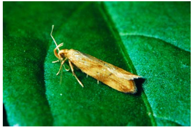
Abb. 5: Cephalispheira ferrugella ([D.& S.], 1775) 1 ♂ Lf. 10.06.2005, Schattertriesch (Schatterberg)