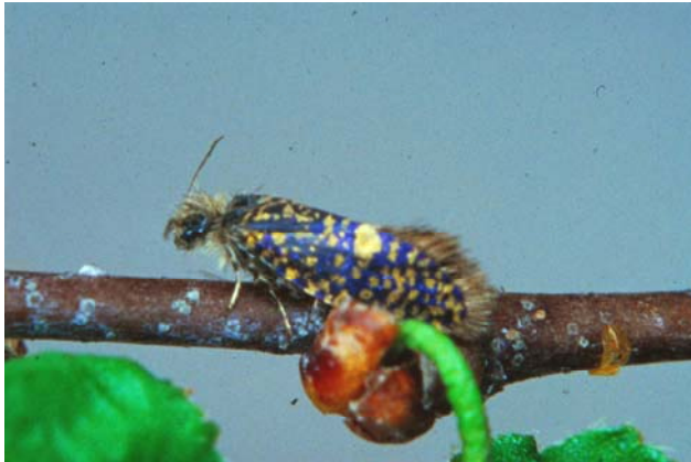
Abb.13: Eriocrania sparrmannella (BOSC, 1791) 1 ♂ Tf. 17.04.2005, Neunkirchen (Betzenhölle)