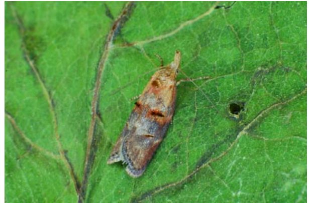
Abb. 4: Anchinia cristalis (SCOPOLI, 1763) 1 ♂ Lf. 06.06.2007, Niedergailbach (Buchenberg)