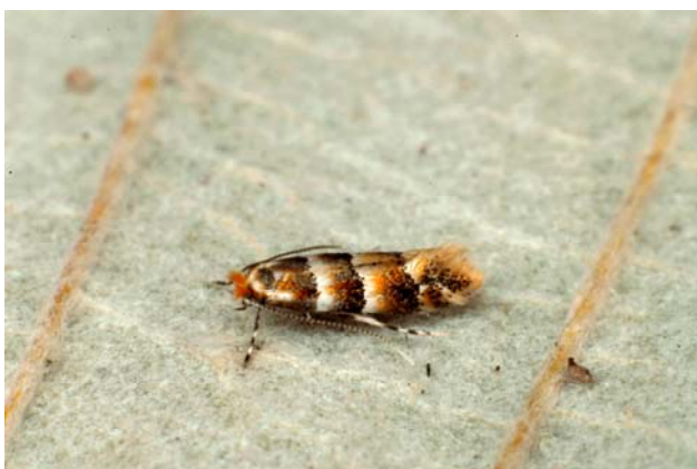
Abb. 15: Phyllonorycter froelichiella (ZELLER, 1839), 1 ♂ e.o. 12.02.2005, Dreisbach (Saarschleife)