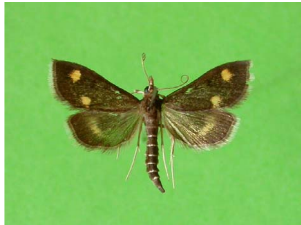
Abb. 12: Ostrinia quadripunctalis ([D&S.], 1775) 1 ♂ Lf. 08.06.2006, BW-Kaiserstuhl, Oberbergen (Badberg)