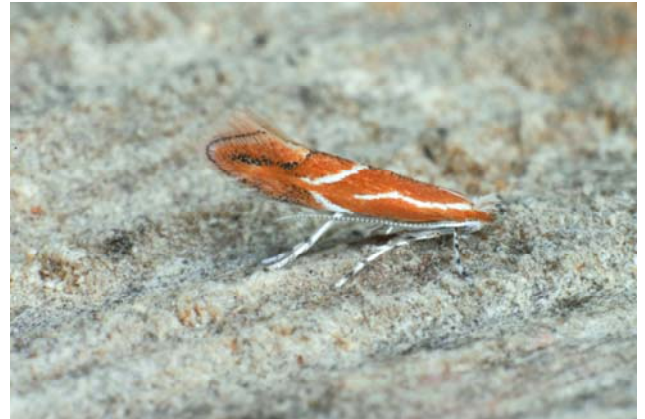
Abb.16: Phyllonorycter salictella (ZELLER, 1846) 1 ♂ e.o. 12.01.2005, Illingen