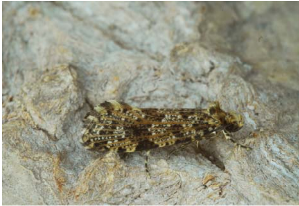
Abb. 1: Montescardia tessulatellus (L.& Z.,1846) 1 ♂ Lf. 19.07.2002, Illingen (Garten HIR1)