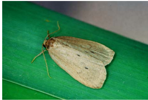
Abb. 11: Pelosia obtusa (H.-S., 1847) 1 ♂ Lf. 06.08.2004, Überherrn (Bistaue)