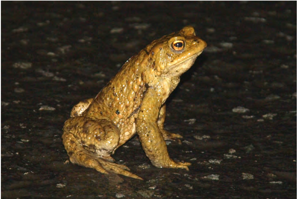
Abb. 1: Erdkrötenmännchen sucht in aufgerichteter Haltung nach einem Weibchen. Hierfür platzieren sich die Tiere an übersichtlichen, offenen Stellen im Gelände – was auch oftmals eine geteerte Straße darstellen kann.